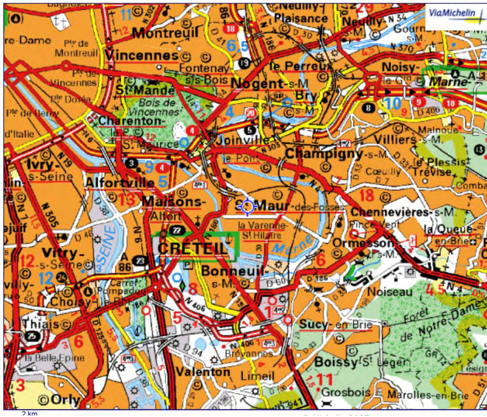
Plan du quartier

En voiture, cf les deux plans ci-dessous